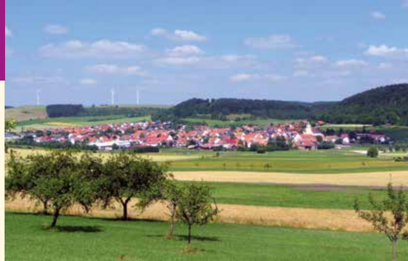
▲ Rückblick aufs Dorf aus Richtung Burghalde (Südwest)

Der Rundweg biegt jetzt nach Osten und Norden um und geht auf halber Höhe entlang dem Tal der Woog (vgl. Rundwanderweg 2) zurück zum Parkplatz.