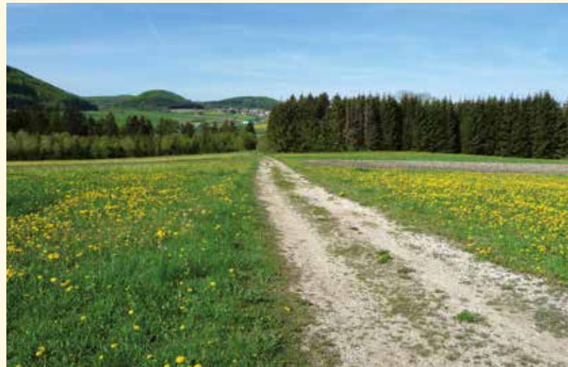
▼ Der „Ablimes“ führt weiter in Richtung Ringingen