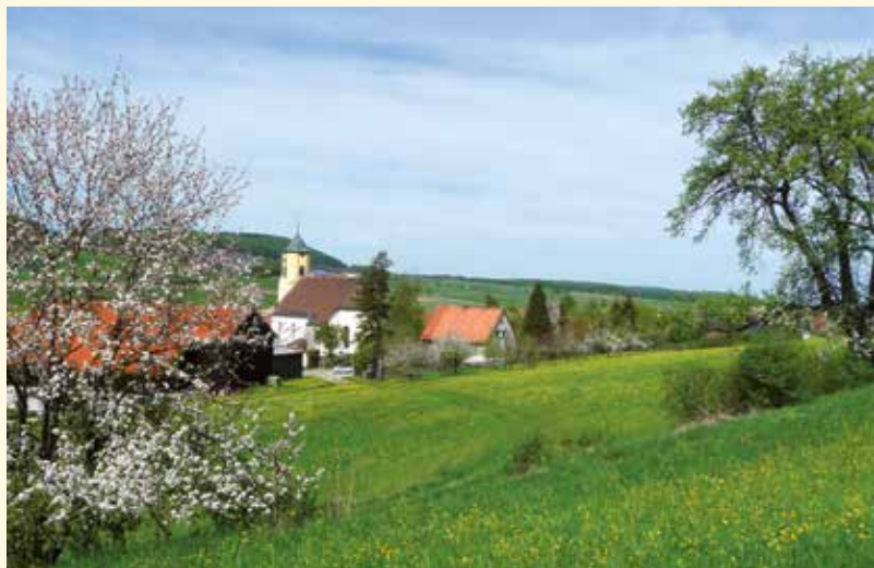
▼ Blick auf die Pfarrkirche St. Stephan aus Richtung Unter der Halde (Südost)