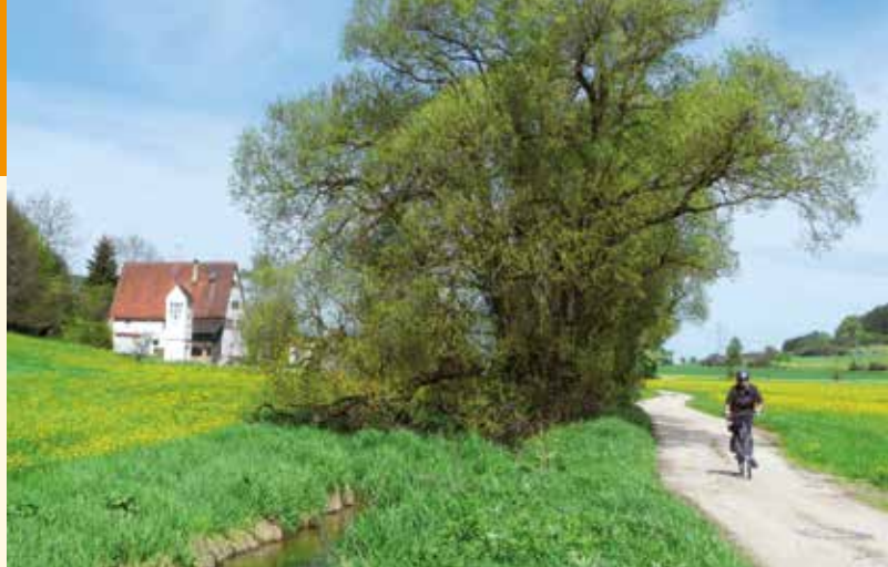
▲ Auf dem Lauchert-Radweg bei der Melchinger Mühle

Nach einem bequemen Abstieg durchquert man nun den Talgrund der Lauchert (710 m) oberhalb der alten Melchinger Mühle hinüber zum Hirschtal und geht am Waldrand unter der Kohlhalde hin, zuletzt vorbei an der barock-klassizistischen, mit einem Freskenzyklus ausgemalten Pfarrkirche St. Stephan (1769), zum Sportgelände zurück.