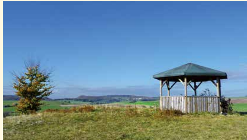
▼ Pavillon auf dem Kalkofen, Blick nach Norden zum Albrand