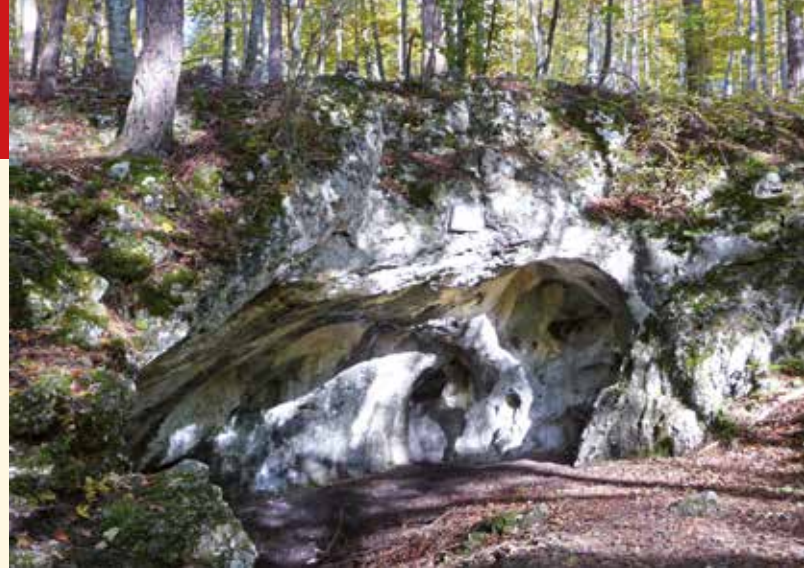
▲ Sommerkirchhöhle, Wohnplatz steinzeitlicher Menschen

Die Route verläuft nun in einer weiten Schleife durch Wald und Wiesen bis zum Feriendorf Sonnenmatte, von dort hinunter zum Wanderparkplatz vor Erpfingen (mit Anschluss an das Sonnenbühler Wanderwegenetz) und, vorbei an der Bobbahn/Skilift-Anlage, durch das bewaldete Melchinger Tal zurück zur Albvereinshütte. Bevor man diese erreicht, bietet sich ein kurzer Abstecher zu einem Holzpavillon an, der auf der kahlen Bergkuppe Kalkofen (823 m) errichtet wurde und eine instruktive Rundschau auf die typische Kuppenalblandschaft bietet.