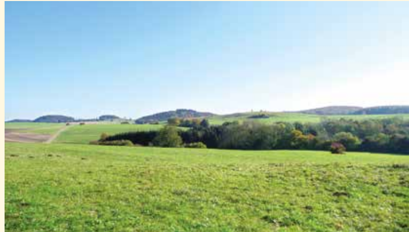
▼ Blick vom Himmelberg albeinwärts (Kuppenalb)