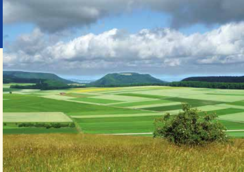
▲ Blick vom Himmelberg zum Farrenberg (Schichtflächenalb)

Bei klarem Wetter dehnt sich das Blickfeld in weite Fernen aus: nach Nordwesten über das Neckarland hinweg bis zur Hornisgrinde im Nordschwarzwald und in Richtung Süden sogar bis zu den Alpen mit der Roten Wand im Lechquellengebirge als auffälligster Erhebung in der Bergkulisse. Ausgangspunkt für diesen Rundgang ist der „Wanderparkplatz Pfaffenberg“ (790 m).