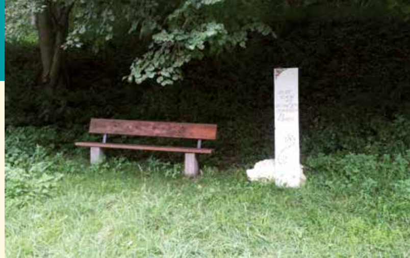
▲ Bänke mit Schild am „Weiherbach“

Die Bänke am Weg bieten Ruhe und oft Aussicht auf das Dorf oder die Landschaft. Die liebevoll gestalteten, weißen Tafeln neben den Bänken, laden mit bedächtigen Sprüchen zur Besinnung und zum Nachdenken ein. Die Abwechslung von Bewegung, Ruhe, bewussten Ausblicken und den anregenden Texten lassen ganz besondere Momente und Eindrücke in Melchingen erleben.