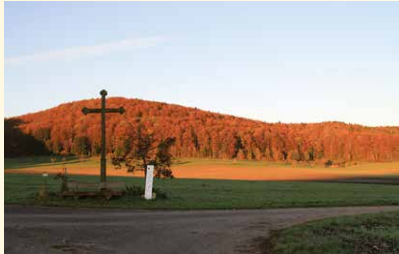
▼ Herbstwald beim Bänklesweg am „Pfattenkreuz“